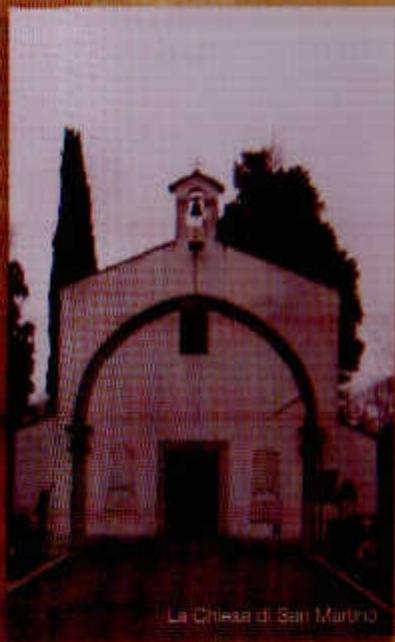
La Chiesa di San Martino