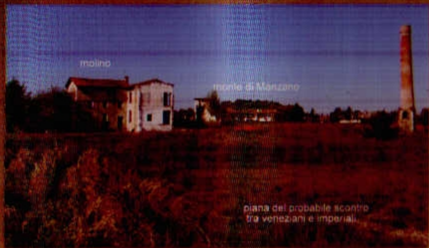
piana del probabile scontro tra veneziani e imperiali.