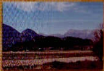
Il Colle di Osoppo e la piana circostante