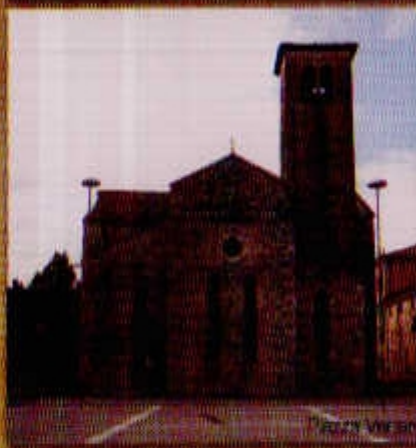
Chiesa di San Venerio

In questo luogo (oggi Piazza Venerio) dove sorgeva palazzo Savorgnan, il 26 febbraio 1511, durante una festa in maschera si accese l'amore fra Lucina Savorgnan e Luigi Da Porto.